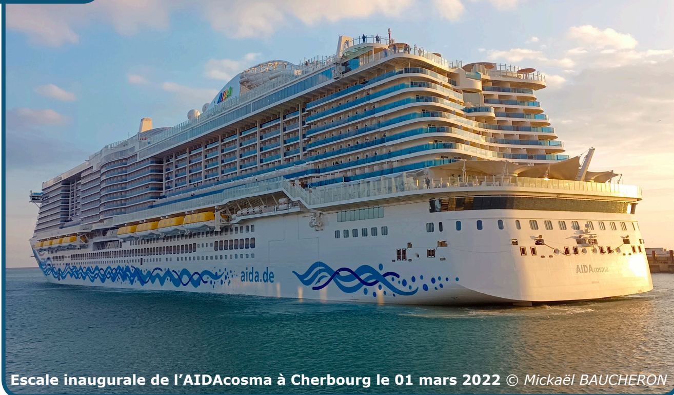
Escale inaugurale de l'AIDAcosma à Cherbourg le 01 mars 2022