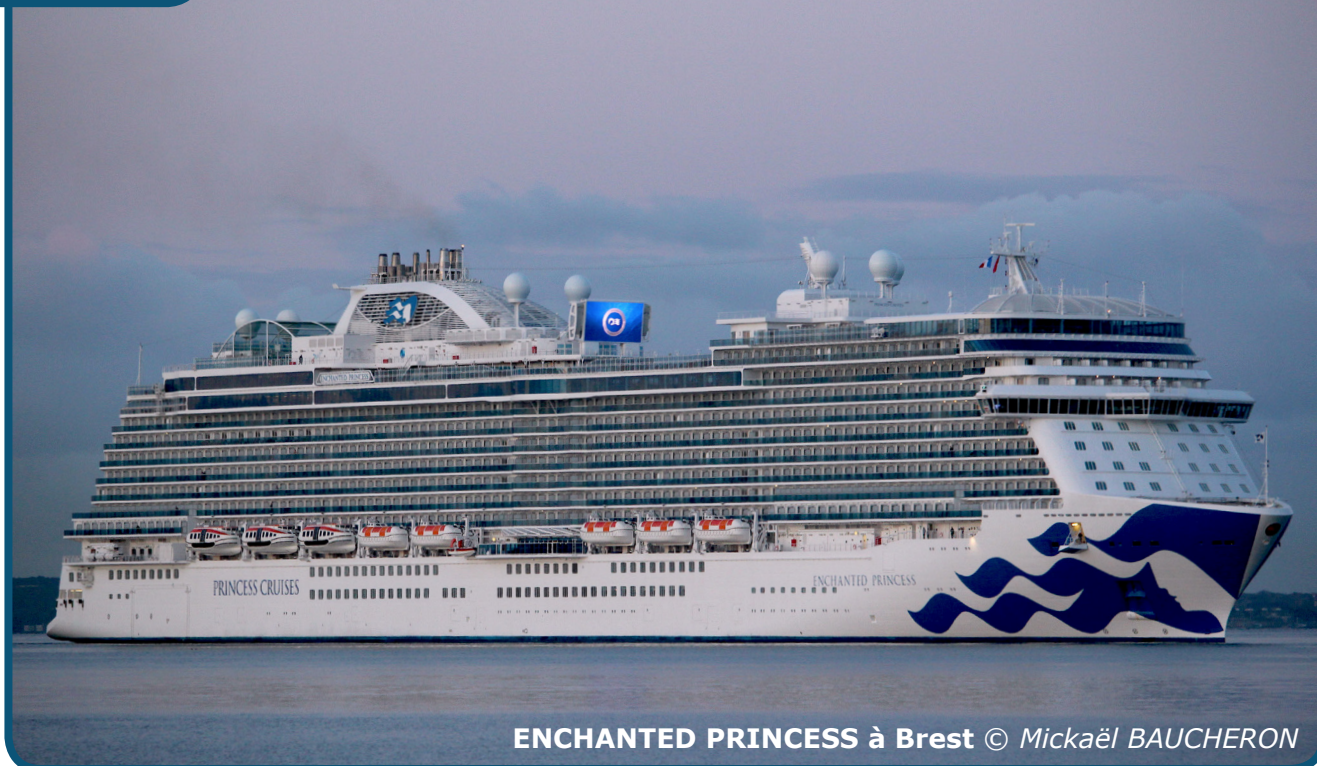
ENCHANTED PRINCESS à Brest