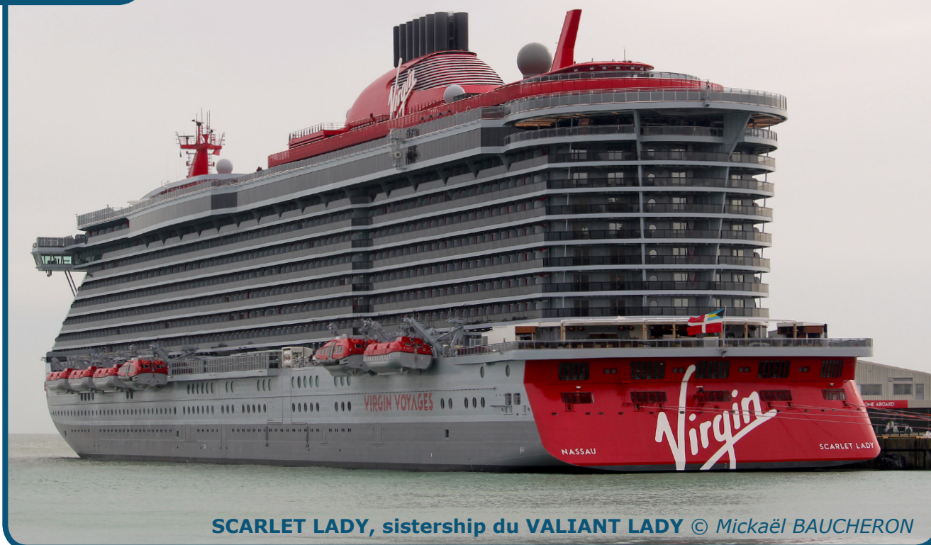
SCARLET LADY, sistership du VALIANT LADY