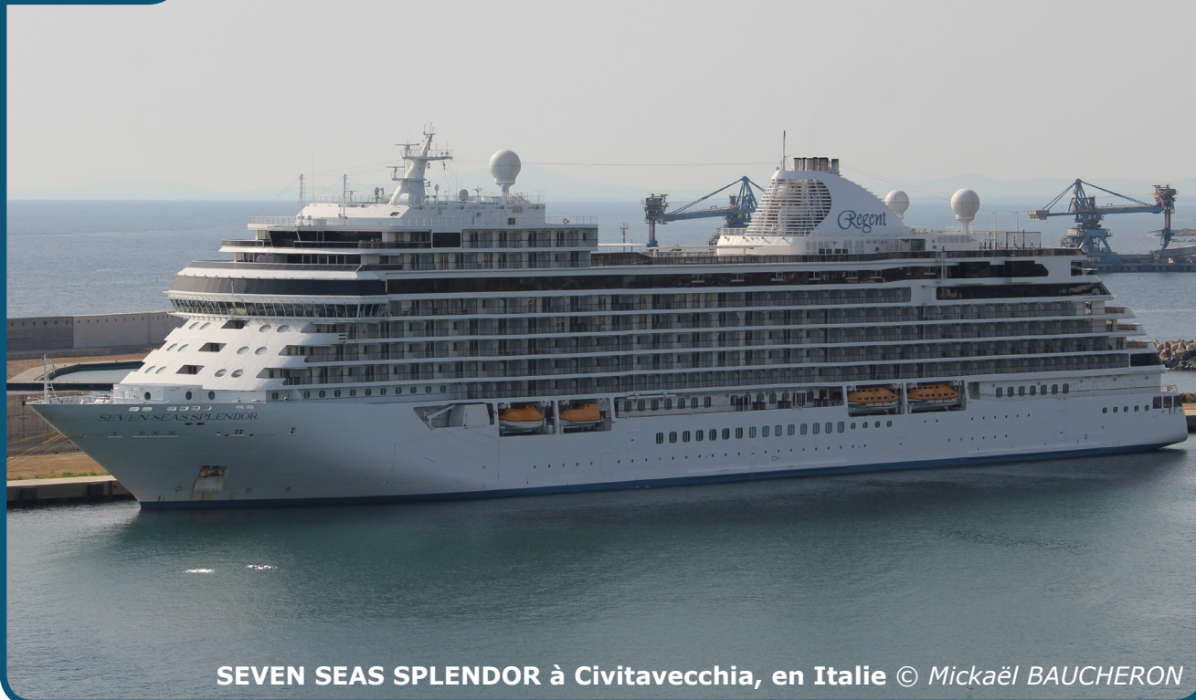
SEVEN SEAS SPLENDOR à Civitavecchia, en Italie